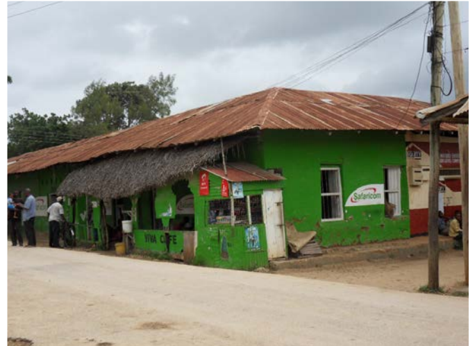
Lancien palais du sultan à Witu

effet d'abord installés à Kau, centre depuis longtemps déjà dans l'orbite commerciale de Pate 13 et qui conserve un débouché sur l'océan, avant de partir pour Witu ; mais les raisons de ce départ restent obscures.